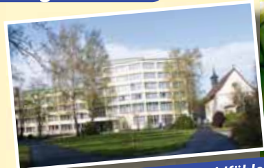
Wohnen und Pflege zum Wohlfühlen

Überzeugen Sie sich selbst von unserem aufmerksamen Service und lernen Sie unser motiviertes Personal kennen. Wir dürfen uns freuen, Ihnen unser Haus vorstellen zu können.