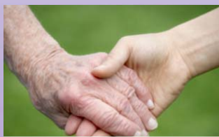
Beratung vor Ort