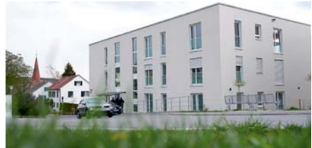
Unsere Praxis in Engen

An unseren Standorten nutzen wir modernste Diagnostik und kombinieren diese mit der langjährigen Erfahrung unserer Ärzte, um eventuell vorhandene Erkrankungen festzustellen und zu behandeln.