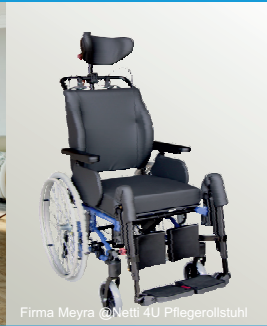
Firma Meyra @Netti 4U Pflegerollstuhl