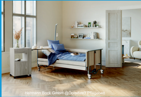
Hermann Bock GmbH @Domiflex3 Pflegebett