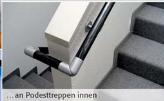
... an Podesttreppen innen