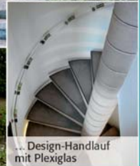
Design-Handlauf mit Plexiglas