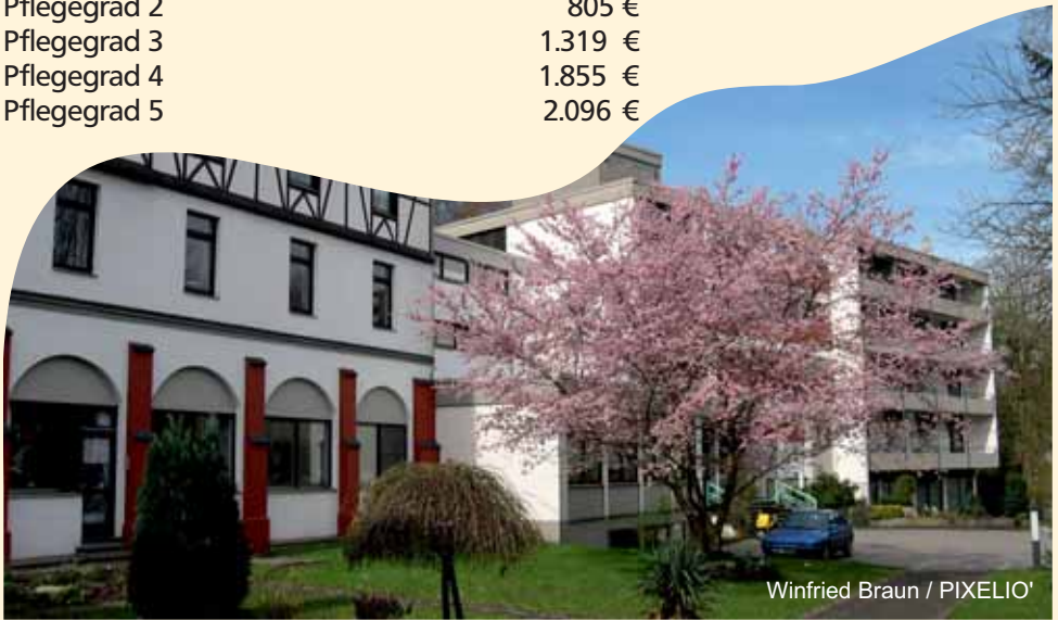
Winfried Braun / PIXELIO