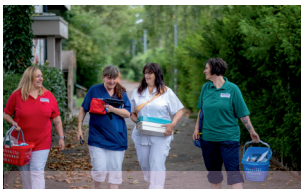
Unterstützungsangebote im Alltag und der Haushaltsführung