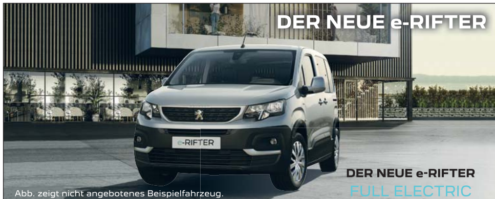
Abb. zeigt nicht angebotenes Beispielfahrzeug.