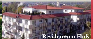
Residenz am Fluß

Möchten Sie sich und Ihren Partner gut versorgt wissen? Dann kommen Sie zu uns in die fröhlichen Seniorengemeinschaften der Residenzen Schloß Stetten.