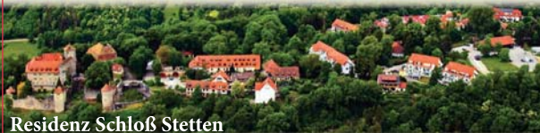
Residenz Schloß Stetten