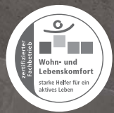
Bild: HEWI_System 900

Riedweg 22 | 88471 Laupheim-Baustetten | Tel. 07392 9733-0 E-Mail info@wolfmaier-haustechnik.de | www.wolfmaier-haustechnik.de