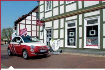
Unser Fachgeschäft in Wunstorfs Fußgängerzone.