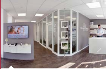
Erleben Sie neueste Technik in modernem Ambiente.